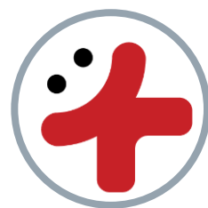
Волонтеры - медики