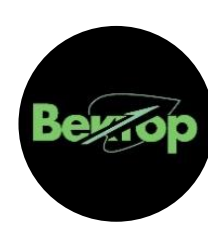
Экологический центр студентов «Зеленый вектор»